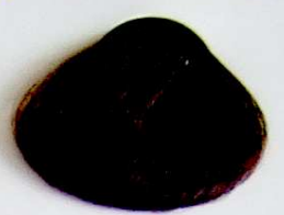
5 Castaño Claro