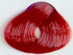
6.66 Rubio Oscuro Rojizo Profundo

• Golden Red Dark Blonde • Blond Foncé Rouge Doré • أشقر داكن ضارب إلى الحمرة مذهب