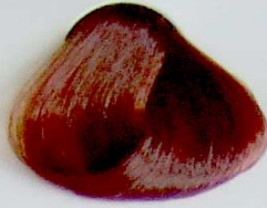
7.43 Rubio Cobrizo Dorado

• Copper Ligth Blonde • Blond Clair Cuivrè • أشقر فاتح نحاسي