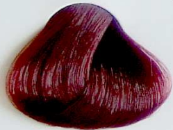
5.65 Castaño Claro Rojo Caoba

• Red Mahogany Ligth Chestnut • Châtain Clair Rouge Acajou • كستنائي فاتح أحمر كابلية