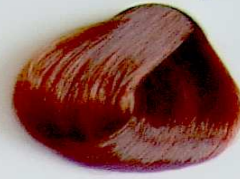
6.45 Rubio Oscuro Cobrizo Caoba

• Intense Copper Blonde • Blond Cuivrè Intense • أشقر نحاسي داكن