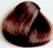
8.1 Rubio Claro Ceniza