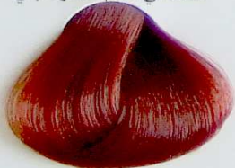
7.64 Rubio Rojizo Cobrizo

• Intense Red Dark Blonde • Blond Foncé Rouge Profond • أشقر داكن ضارب إلى الحمرة جدا