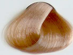
9.37 Rubio Muy Claro Marron

• Brown Blonde • Blond Marron • أشقر بني