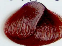
6.63 Rubio Oscuro Rojizo Dorado

• Bright Red • Rouge Brillant • أحمر ساطع