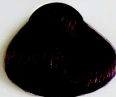
6.1 Rubio Oscuro Ceniza