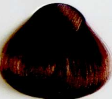
7.3 Rubio Dorado