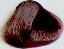
6.7 Rubio Oscuro Marrón

• Brown Dark Blonde • Blond Foncé Marron • أشقر داكن بني