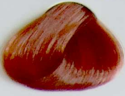
8.4 Rubio Claro Cobrizo

• Copper Ligth Blonde • Blond Clair Cuivrè • أشقر فاتح نحاسي