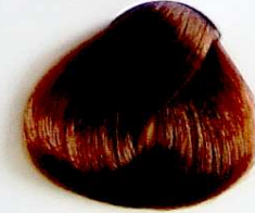
7.33 Rubio Dorado Intenso