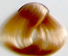
900 Rubio Clarissimo