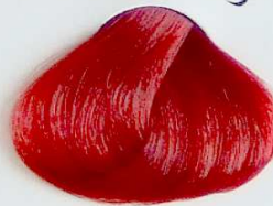
6000 Rojo Luminoso

• Intense Red Ligth Chestnut • Châtain Clair Rouge Profond • كستنائي فاتح ضارب إلى الحمرة داكن