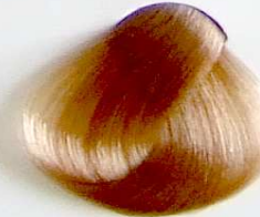
902 Rubio Muy Claro Beige