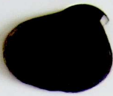
3 Castaño Oscuro