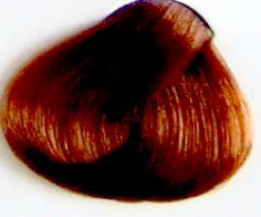
8.33 Rubio Claro Dorado Intenso