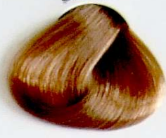
9 Rubio Muy Claro