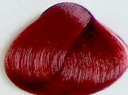
5.66 Castaño Claro Rojizo Profundo

• Red Mahogany Ligth Chestnut • Châtain Clair Rouge Acajou • كستنائي فاتح أحمر كابلية