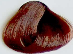
7.7 Rubio Marrón

• Brown Dark Blonde • Blond Foncé Marron • أشقر داكن بني