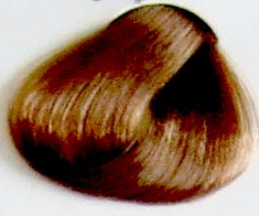
8 Rubio Claro