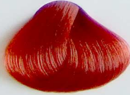
7004 Cobrizo Rojizo