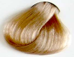
10.01 Rubio Platino Natural Ceniza