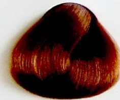
8.3 Rubio Claro Dorado