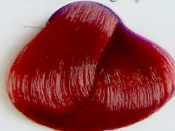
7.66 Rubio Rojizo Profundo

• Copper Red Blonde • Blond Rouge Cuivrè • أشقر ضارب إلى الحمرة نحاسي