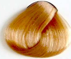
10.03 Rubio Platino Natural Dorado