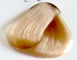
10 Rubio Platino