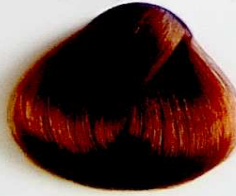
8.34 Rubio Claro Dorado Cobrizo