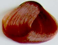
7.44 Rubio Cobrizo Intenso

• Golden Copper Blonde • Blond Cuivrè Dorè • أشقر نحاسي مذهب