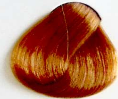
9.3 Rubio Muy Claro Dorado