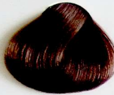
7.1 Rubio Ceniza