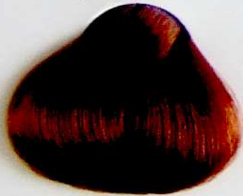
7.34 Rubio Dorado Cobrizo