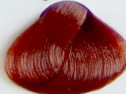
8.66 Rubio Claro Rojizo Profundo

• Intense Red Blonde • Blond Rouge Profond • أشقر ضارب إلى الحمرة داكن