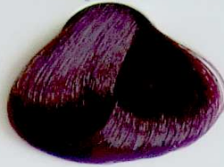
5.20 Caoba Violin Intenso

• Light Mahogany • Acajou Clair • كابلية فاتح