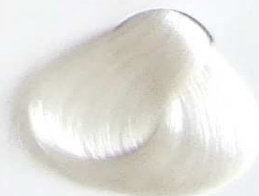
100 Base Aclaradora