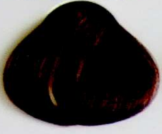
6 Rubio Oscuro