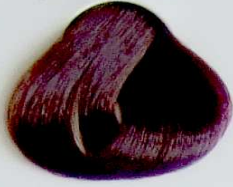
5.5 Caoba Claro

• Mahogany Copper Dark Blonde • Blond Foncé Cuivrè Acajou • أشقر داكن نحاسي كابلية