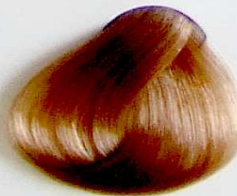
901 Rubio Muy Claro Ceniza