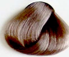
9.1 Rubio Muy Claro Ceniza